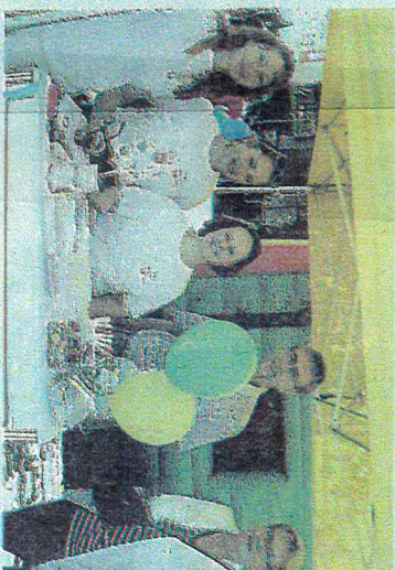
Auch die Caritas stellte ihre Angebote zur Beratung und Integration an einem der Informationsstände vor, während neben ihnen das Team des Hauses der Jugend die Stellung hielt.