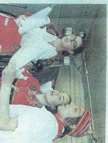
Sie sangen mit Jubelstimmung live, während die portugiesische Tanzgruppe – diesmal auch mit ganz Kleinen Mitwirkenden – auf dem Platz tanzte.